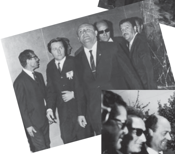
Grubun ilk bira fabrikası olan Ege Biracılık'ın Açılış Töreni (1969).