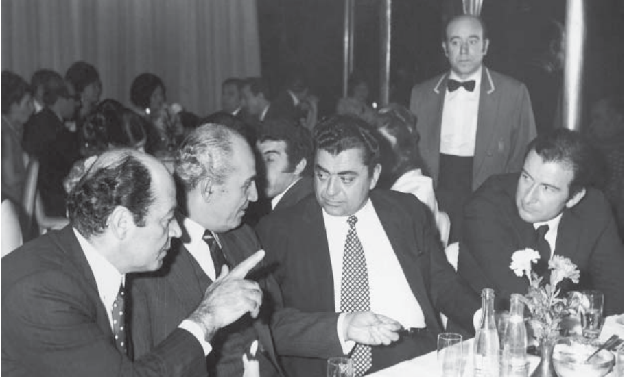
İstanbul Valisi Vefa Poyraz ve Aydın Kent'le yemekte.