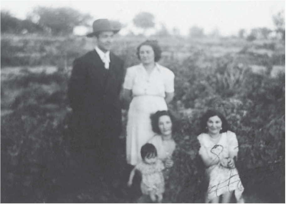
İstanbul'dan Develi'ye yapılan bir ziyaret (15.8.1952).