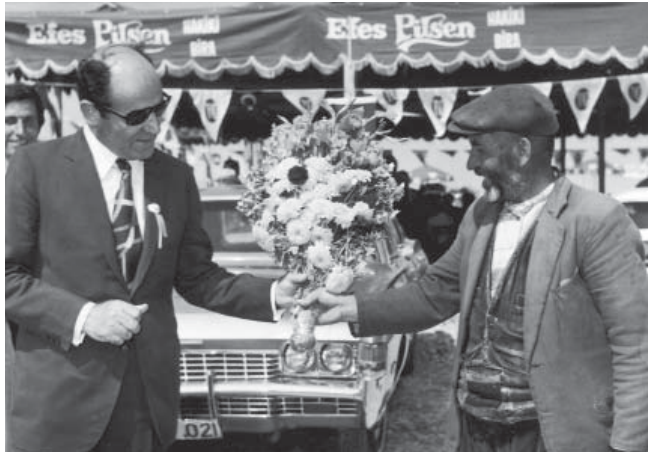
Afyonlu bir köylü İzzet Özilhan'a çiçek veriyor.