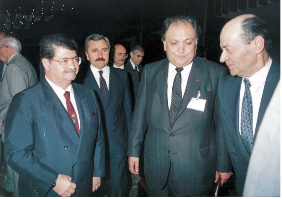
Başbakan Turgut Özal, İstanbul Büyükşehir Belediye Başkanı Bedrettin Dalan ve Nezih Demirkent'le.