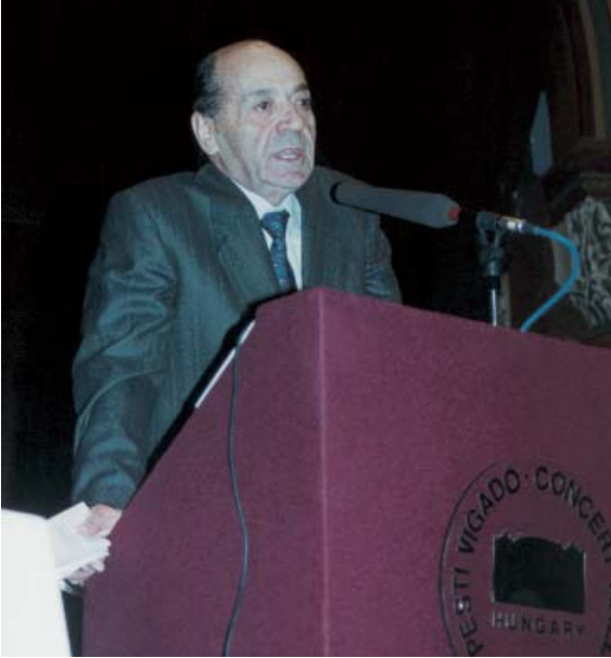
Budapeşte’de Efes Pilsen Bayi toplantısı (1992).