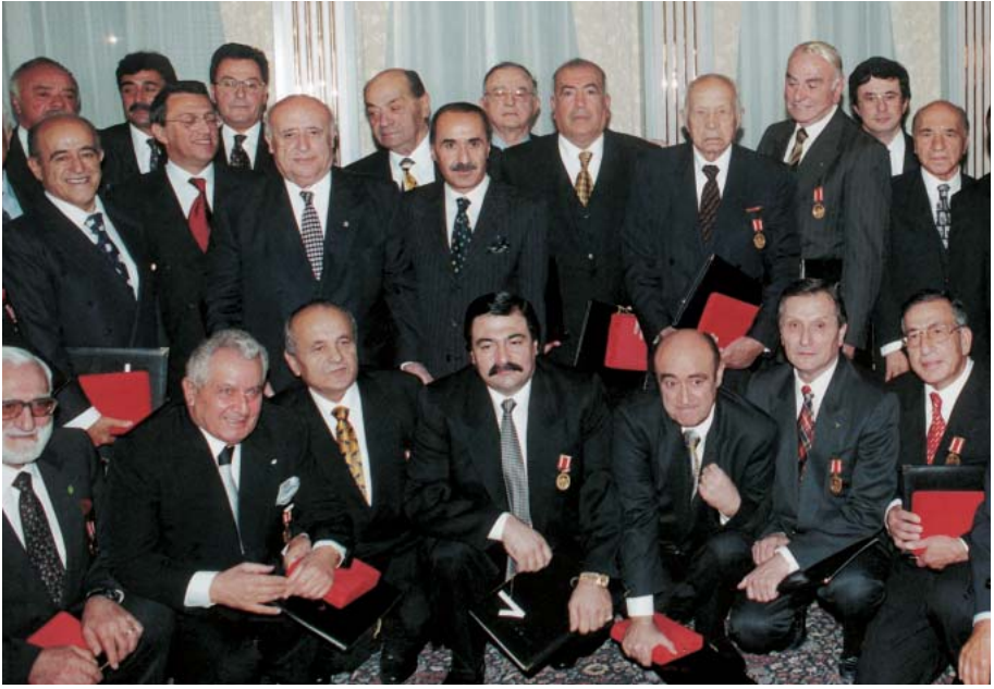
Devlet Üstün Hizmet Madalyası Ödül Töreni.