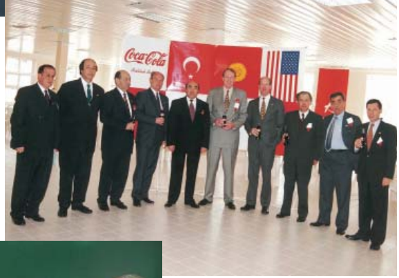
Coca-Cola Bişkek Açılış Töreni(1996).