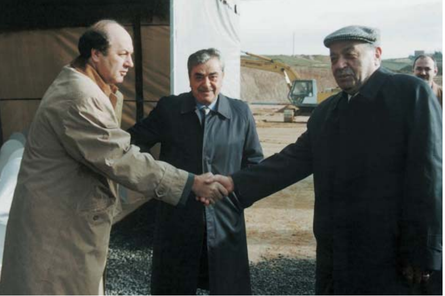
Anadolu Isuzu'nun Gebze Şekerpınar'daki yeni fabrikasının temel atma töreni (21 Ocak 1998).