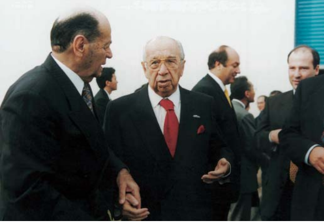
Anadolu Honda Temel Atma Töreni.