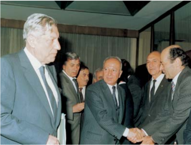
Zamanın Başbakanı Bülent Ulusu ile.