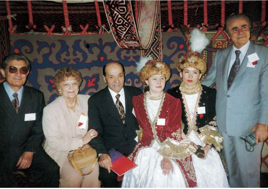
Coca-Cola Biřkek Aılıř Treni (1996).