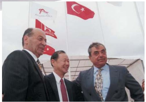
Anadolu Honda Temel Atma Töreni (1996).