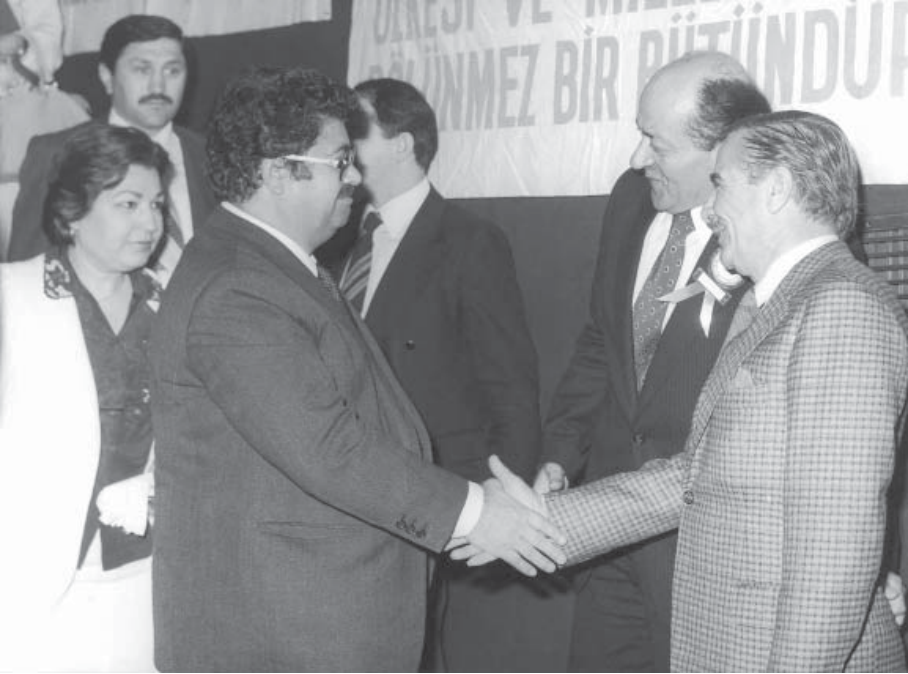
Merhum Turgut Özal ve Eşi Semra Özal ile.