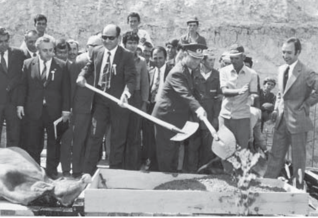
Afyon Malt Fabrikası temel atma töreni (1972).