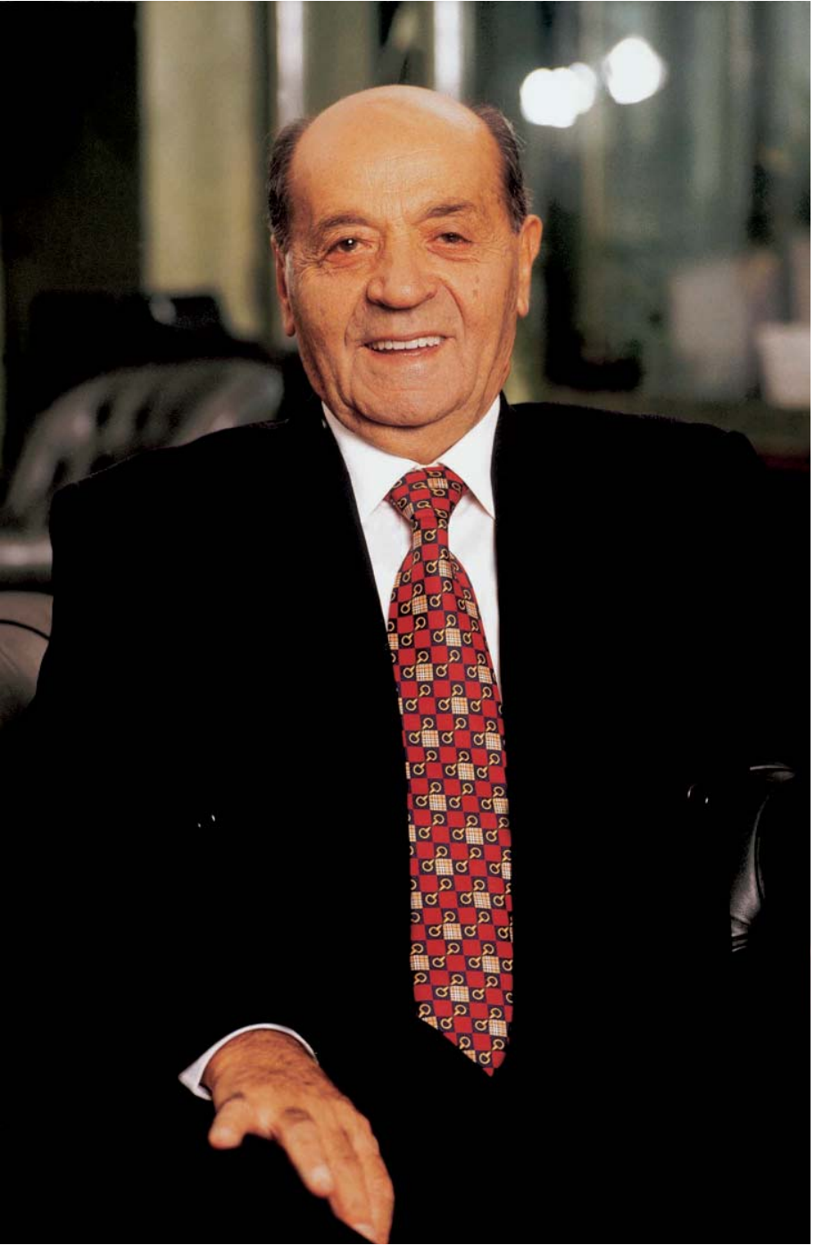
İzzet Özilhan (Ekim 1998)