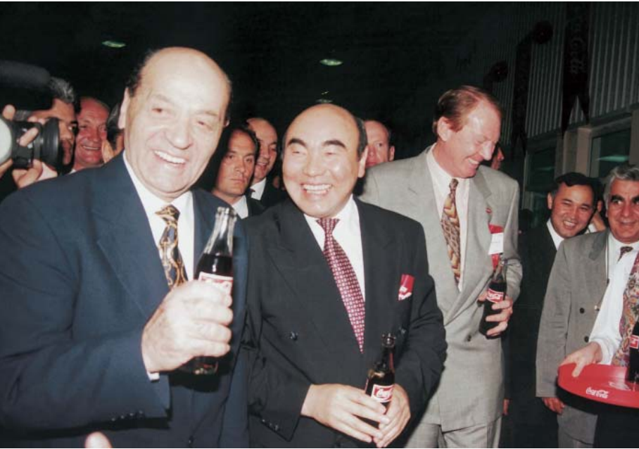
Biřkek'teki Coca-Cola Fabrikasının aılıř treninde Kırđızistan Cumhurbaşkanı Askar Akayev ve Coca-Cola Avrupa Bařkanı Neville Isdell ile.