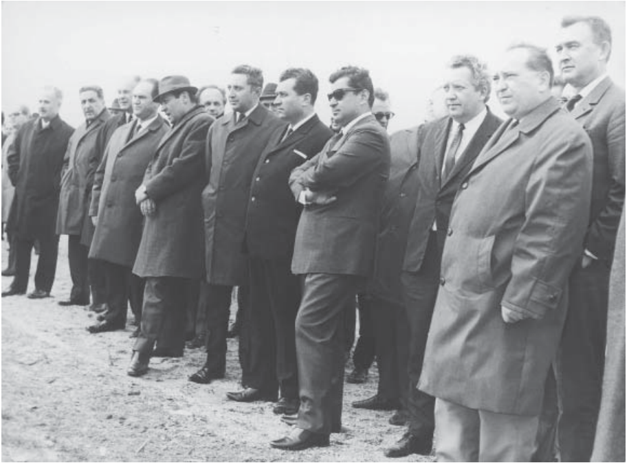
Kartal'daki Otopar fabrikasının temel atma töreni.