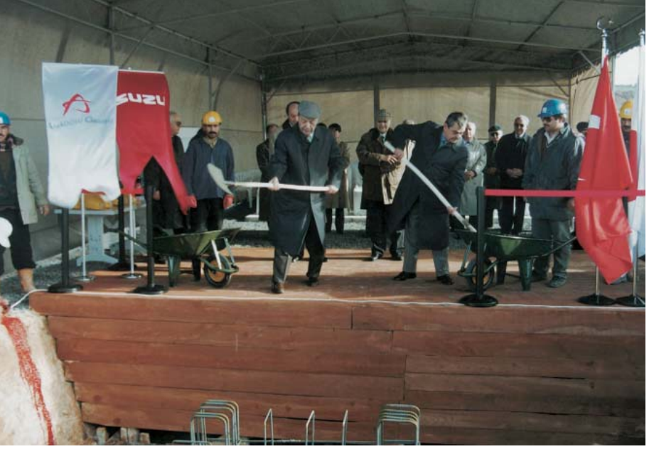
Anadolu Isuzu'nun Gebze Şekerpınar'daki yeni fabrikasının temel atma töreni (21 Ocak 1998).