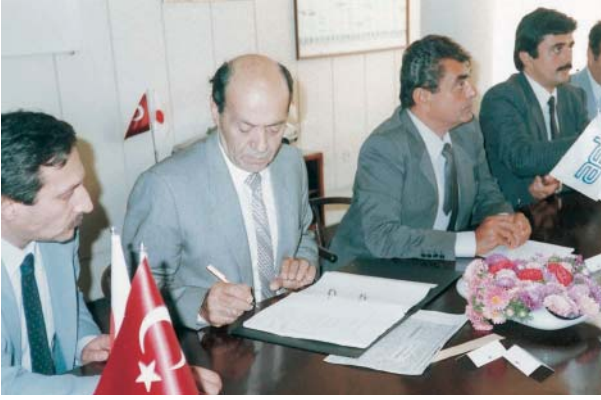
Isuzu ortaklık anlaşması İmza Töreni (1985).