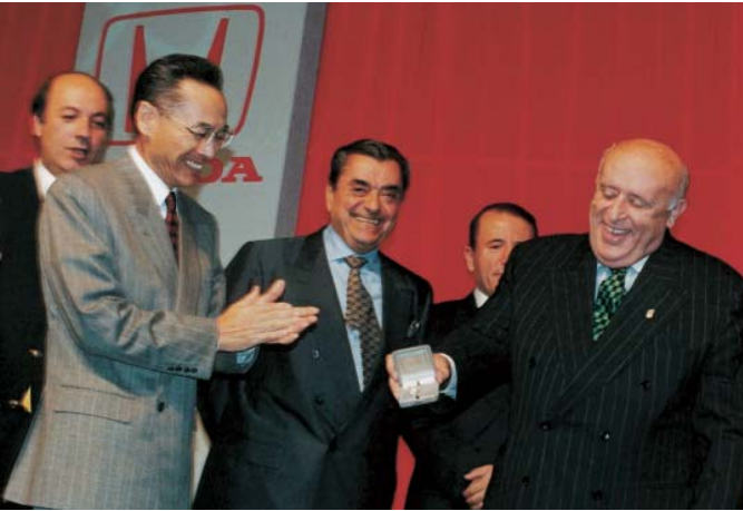
Anadolu Honda Açılış Töreni. (15 Kasım 1997).