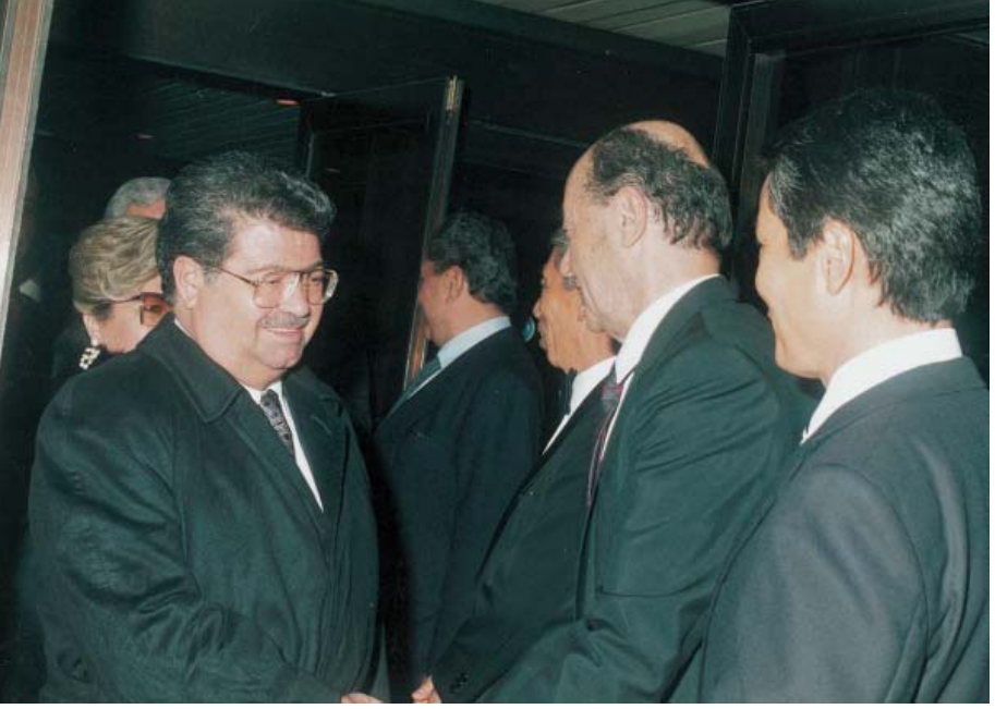
Anadolu Isuzu 10. kuruluş yıldönümü kutlaması (1990).