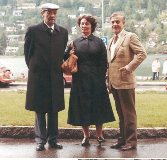
1984 yılında Almanya'da Münih'de Oktoberfest'te.