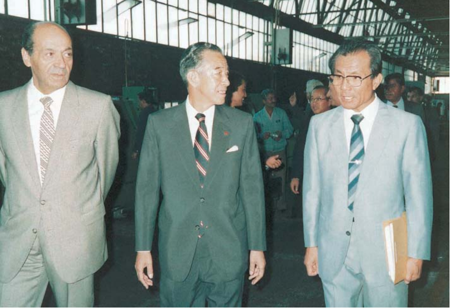
Isuzu ortaklık anlaşması İmza Töreni (1985).