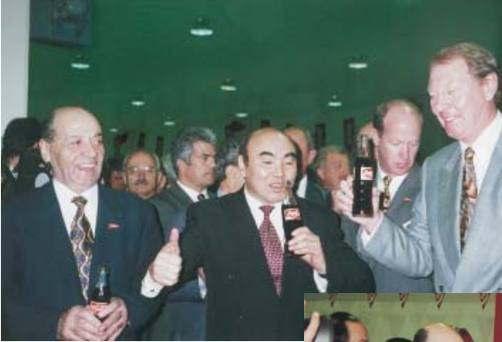
Almaty Coca-Cola Fabrikası'nın açılış töreninde Kazakistan Başbakan Yardımcısı ve Almaty Belediye Başkanı ile.