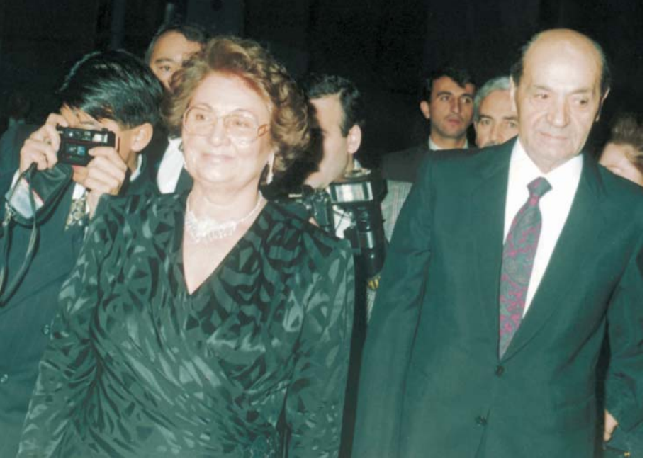
Anadolu Isuzu 10. kuruluş yıldönümü kutlaması (1990).