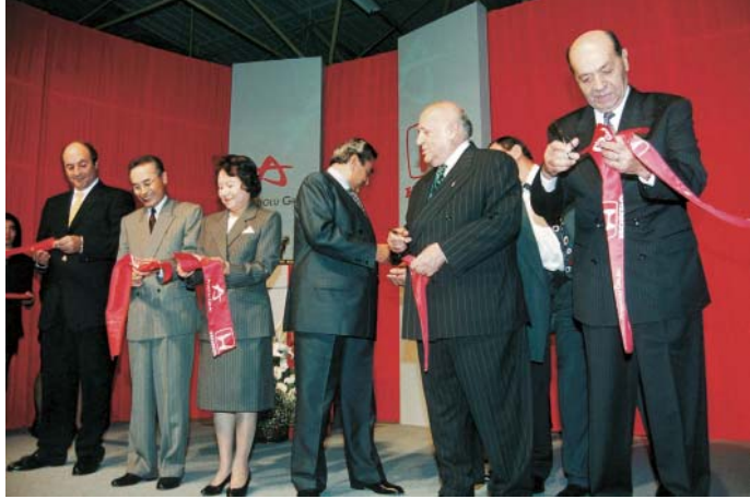
Anadolu Honda Açılış Töreni (15 Kasım 1997).