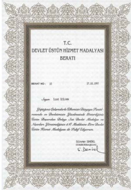
Devlet Üstün Hizmet Madalyası Beratı.