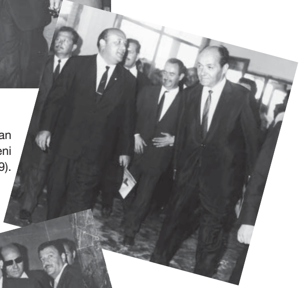
Grubun ilk bira fabrikası olan Erciyas Biracılık'ın Açılış Töreni (29.7.1969).