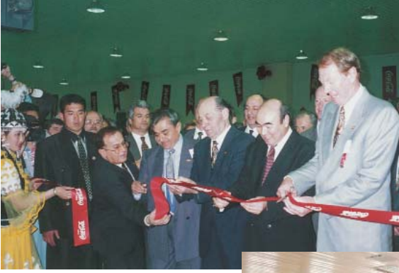
Coca-Cola Bişkek Açılış Töreni (Kırgızistan Cumhurbaşkanı Askar Akayev ile).