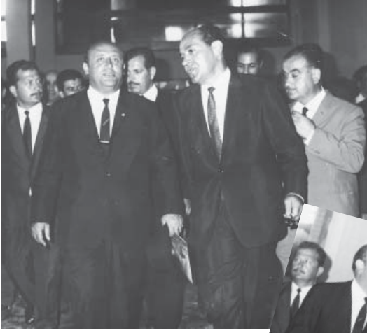
Grubun ilk bira fabrikası olan Erciyas Biracılık'ın Açılış Töreni (29.7.1969) zamanın Başbakanı Süleyman Demirel ile.