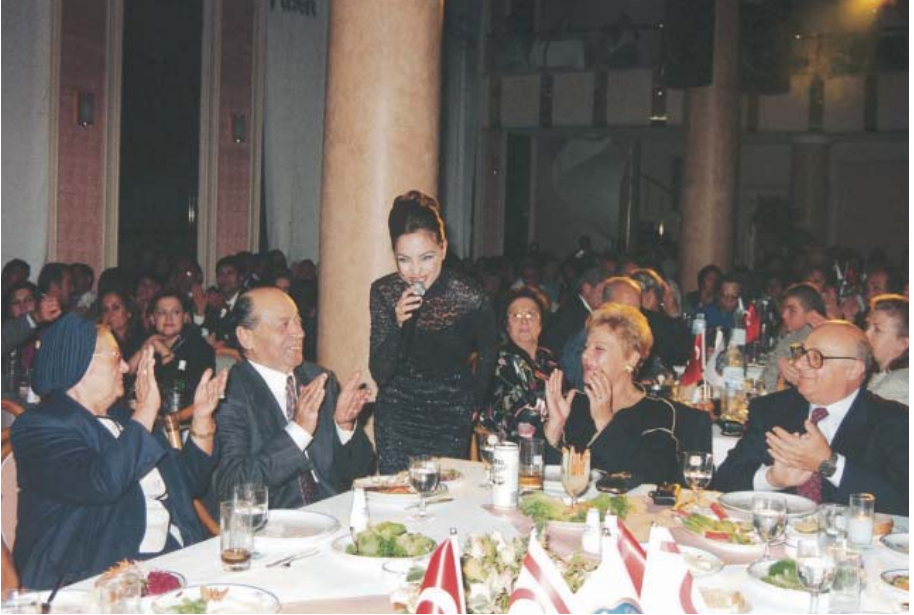
Efes Pilsen Bayiler Toplantısı'nın gala yemeğinde Cumhurbaşkanı Demirel ve eşi ile; Girne Kıbrıs (1996).