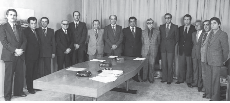
Bir yönetim kurulu toplantısında yönetim kurulu üyeleri ve üst düzey yöneticilerle (1971).