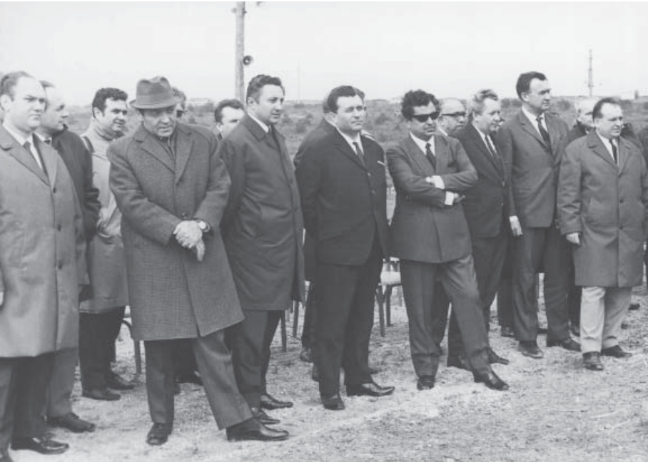
Kartal'daki Otopar fabrikasının temel atma töreni.